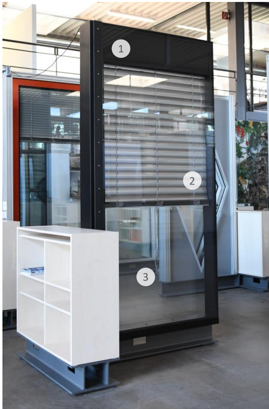
Vorderansicht Front elevation